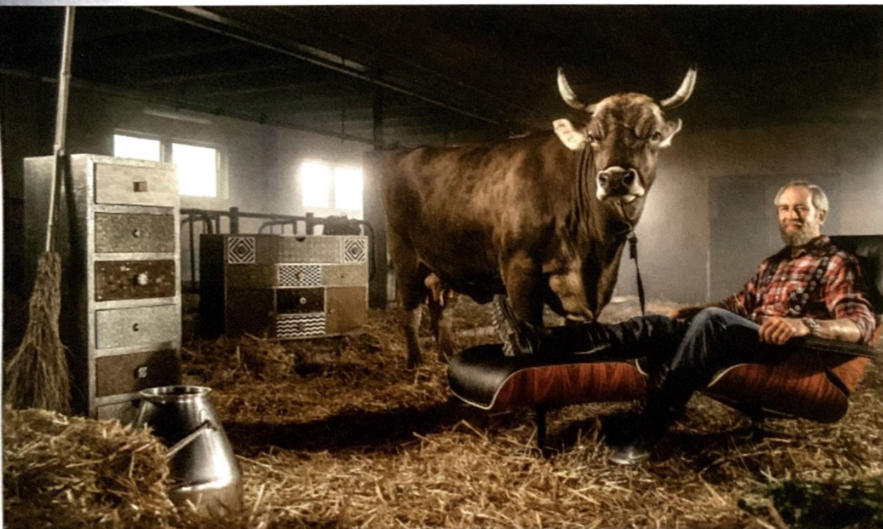
In Freundschaft verbunden: Es ist gut, wenn der Bauer die Kuh an seinem Leben teilhaben lässt ...

oder zu transferieren, äußerst negativ für die Entwicklung des einzelnen Kuhindividuums. Denn zwei Kälber, die aus einer Embryonenteilung entstanden sind, besitzen den gleichen Ätherleib. Daraus resultiert buchstäblich ein Erinnerungsmatsch: Es ist nicht mehr differenzierbar, welche Kuh was erlebt hat. Zudem sind diese beiden Tiere extrem stark miteinander verbunden. Wenn zum Beispiel eine Kuh krank wird, so spürt dies auch ihre andere Hälfte. Die Krankheit muss sich nicht zwingend physisch bei der zweiten Kuh manifestieren, sie erlebt sie aber zweifellos innerlich mit. Werden solche