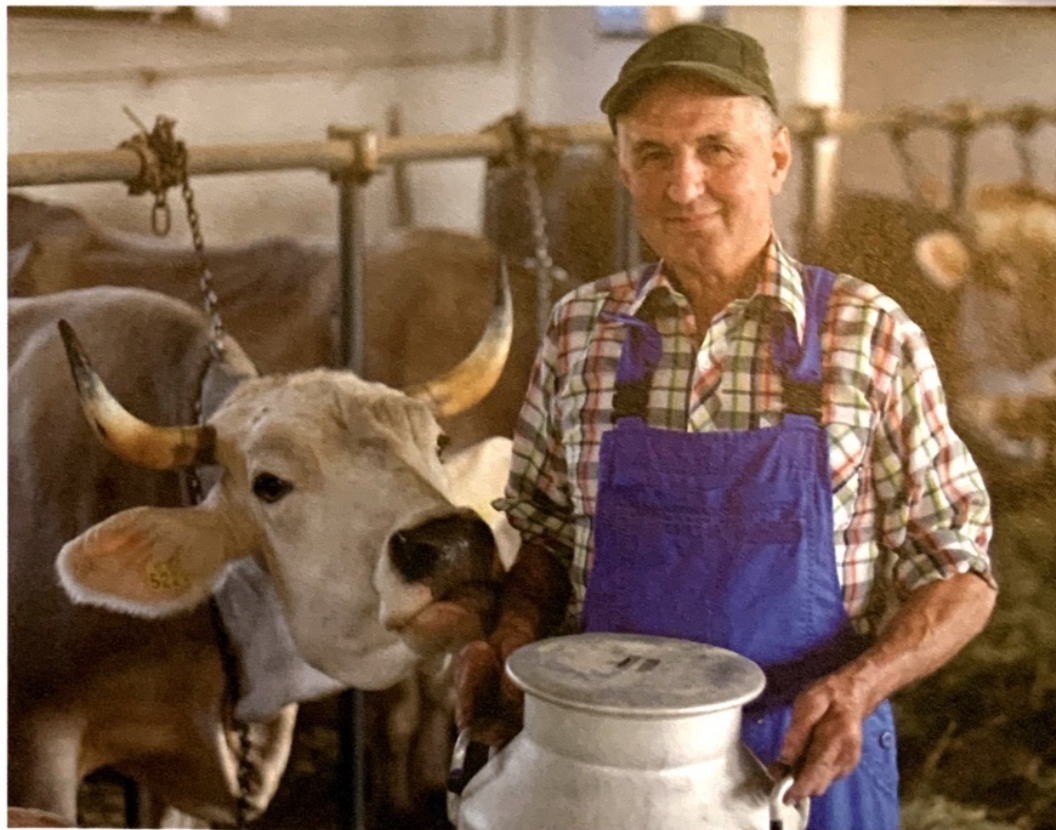
Das Glück im Stall: Die Kuh dankt dem treusorgenden Bauern für seinen respektvollen Umgang und die artgerechte Haltung nicht nur mit erstklassiger Milch.

Auf die Frage, ob in der Milchwirtschaft Handlungsbedarf bestehe, relativiert der Rinder-Engel. Es seien zwar dringende Änderungen notwendig, jedoch dürfen diese nicht kurzfristig umgesetzt werden. Man müsse bedenken, dass die heutigen Hochleistungskühe Milch für drei Kälber geben. Würde