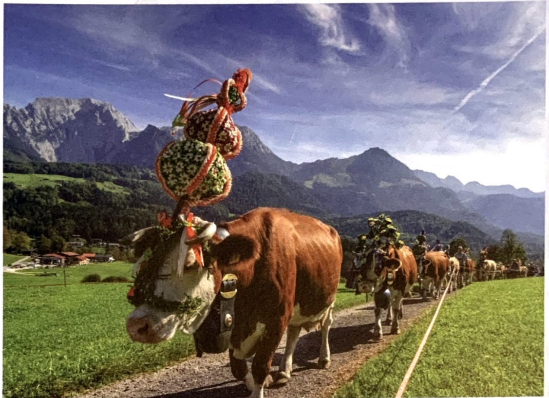
Almbzug in Bayern: Wenn man die Kühe mit Schmuck ehrt, so stärkt dies die Beziehung zwischen Mensch und feinstofflichem Herdenwesen, welches geistig für eine bestimmte Tierherde verantwortlich ist.

Der Rinderengel spricht auch über Pferde. Sie verkörpern das Luftige und haben trockene Nasen, wirken dynamisch und energiegeladener. Pferdeäpfel sind eher fest und trocken. Das kann man von der Kuh nicht gerade behaupten. Sie hinterlässt vielmehr nasse Fladen. Denn die Kuh ist ein sehr 'wässriges' Wesen, was sich schon in ihren großen feuchten Augen, der nassen Nasen- und Mundpartie und dem prallen Euter zeigt. So erstaunt es denn auch nicht, dass es der Kuh beim Grasens in erster Linie um die Säfte geht. Jeder noch so kleine Wassertropfen auf diesem Planeten wird von Undinen, den Elementargeistern des Wassers, beseelt – so auch die Grassäfte. Dank ihres feuchten Wesens ist sich die Kuh dieser Undinen beim Grasens bewusst und nimmt sie dementsprechend gut