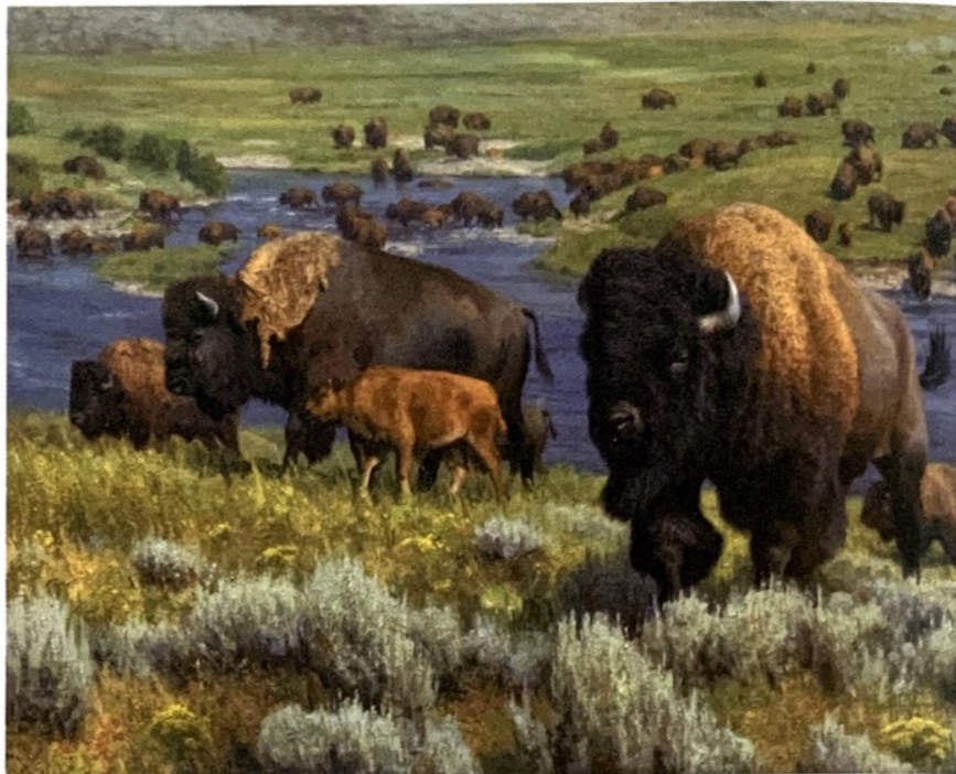
Die wilden Verwandten der Rinder: Auch Kühe möchten wie Bisons frei umherstreifen können – oder wenigstens auf verschiedenen Weiden grasen.

Der Betonboden hingegen nutze zwar die Klauen ab, sei aber ansonsten der „unrhythmischste“ Untergrund, den man sich vorstellen könne. Denn anders als beim Tretmist spiegeln sich in ihm keinerlei kosmische Rhythmen wider.