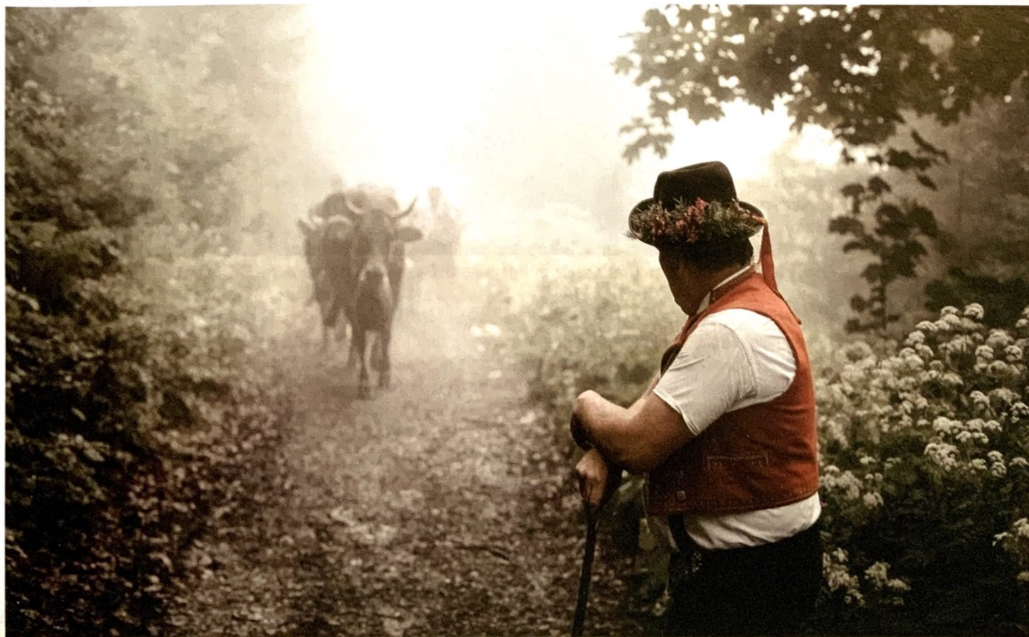
Hüter der Schöpfung: Der Mensch kann maßgeblich zur Höherentwicklung der ihm anvertrauten Tiere beitragen.

Dies ist einer der Gründe, weshalb eine Laktose-Intoleranz bei den nordischen Völkern früher nahezu unbekannt war.